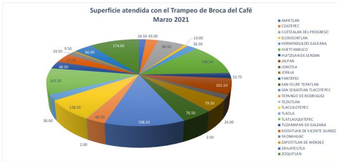
Figura 1. Superficie atendida con Trampeo de la Broca del Café por Municipio