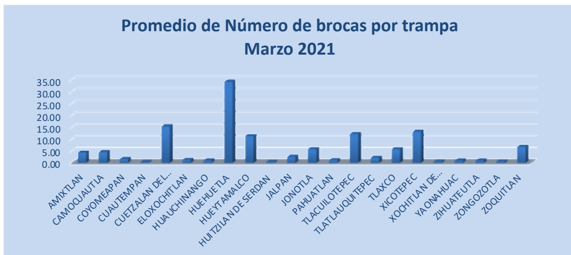
Figura 2. Promedio de número de Broca capturadas por trampa en los Municipio atendidos.